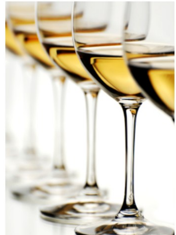
Gläser aller Art

Perfekt für Gastgeber: Sprizzer servieren statt mixen.