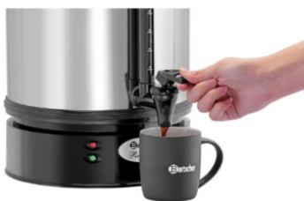
Kaffeemaschine - von Bartscher

Die Regina Plus 40 brüht bis zu 6,8 Liter Filterkaffee in 45 Minuten.