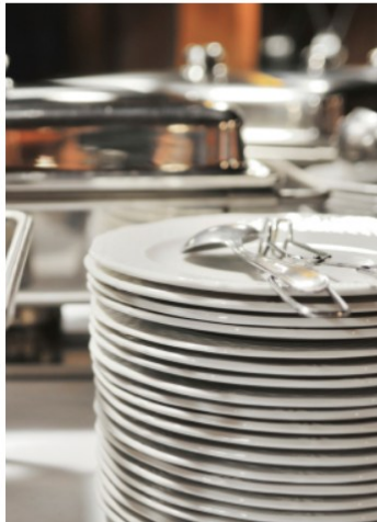
Teller und Besteck

Alles aus einer Hand – alle Artikel sind gepflegt, einsatzbereit und können flexibel zu Ihrem Catering hinzugebucht werden.